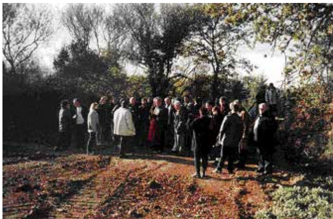
Journée thématique Déchets