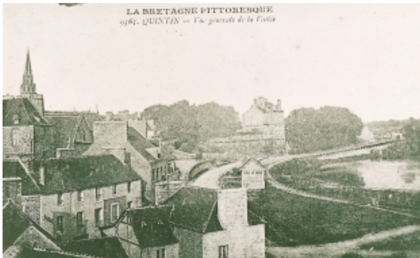
Aux alentours de 1925